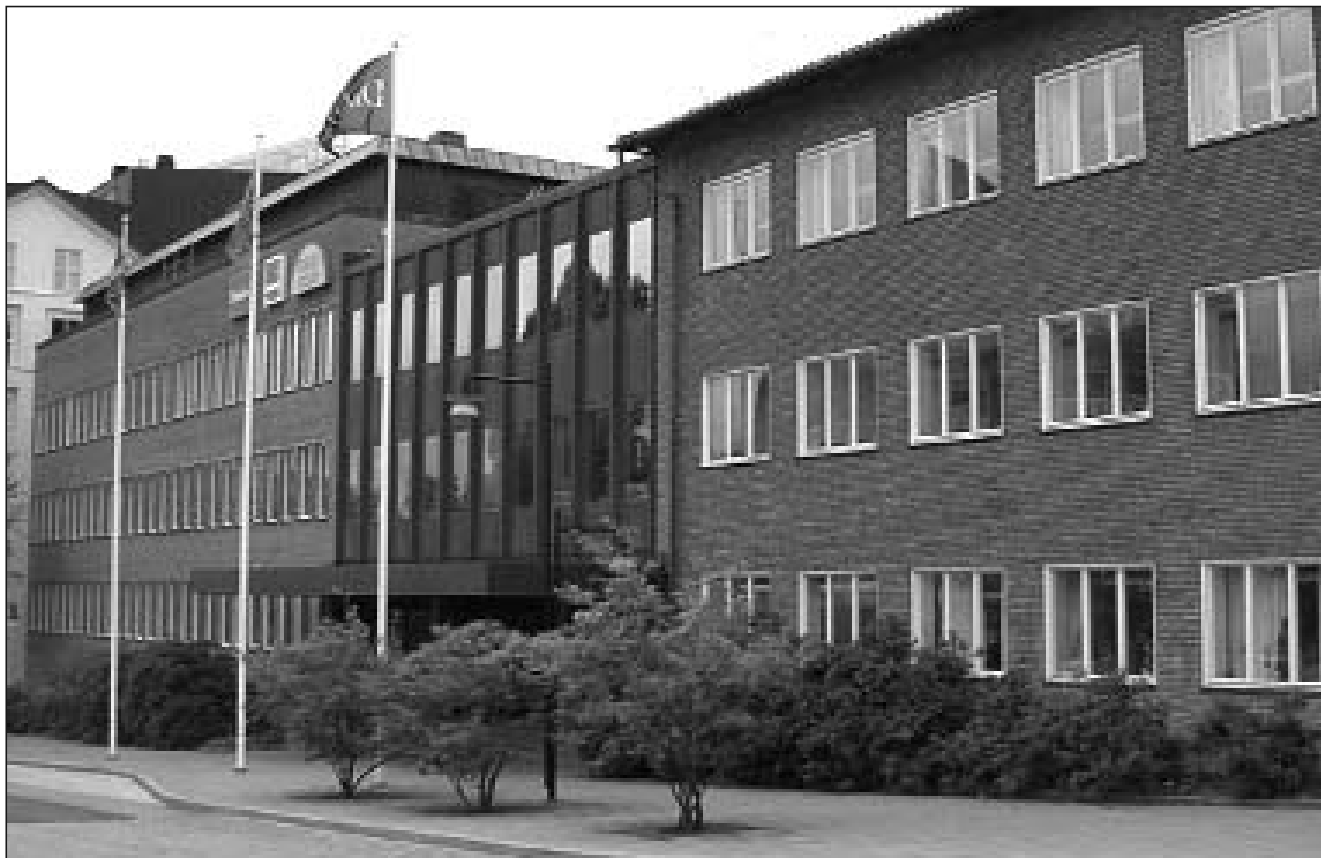
Förbundets lokaler i Sundbyberg finns i Marabous gamla huvudkontor. Tanken att skapa ett centrum för släktforskning har inte lyckats fullt ut.