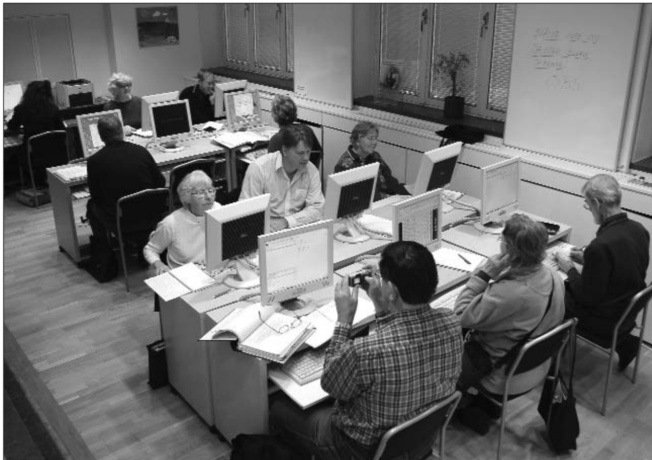
Datasalen i Sundbyberg. En av de resurser som står till släktforskarnas förfogande.