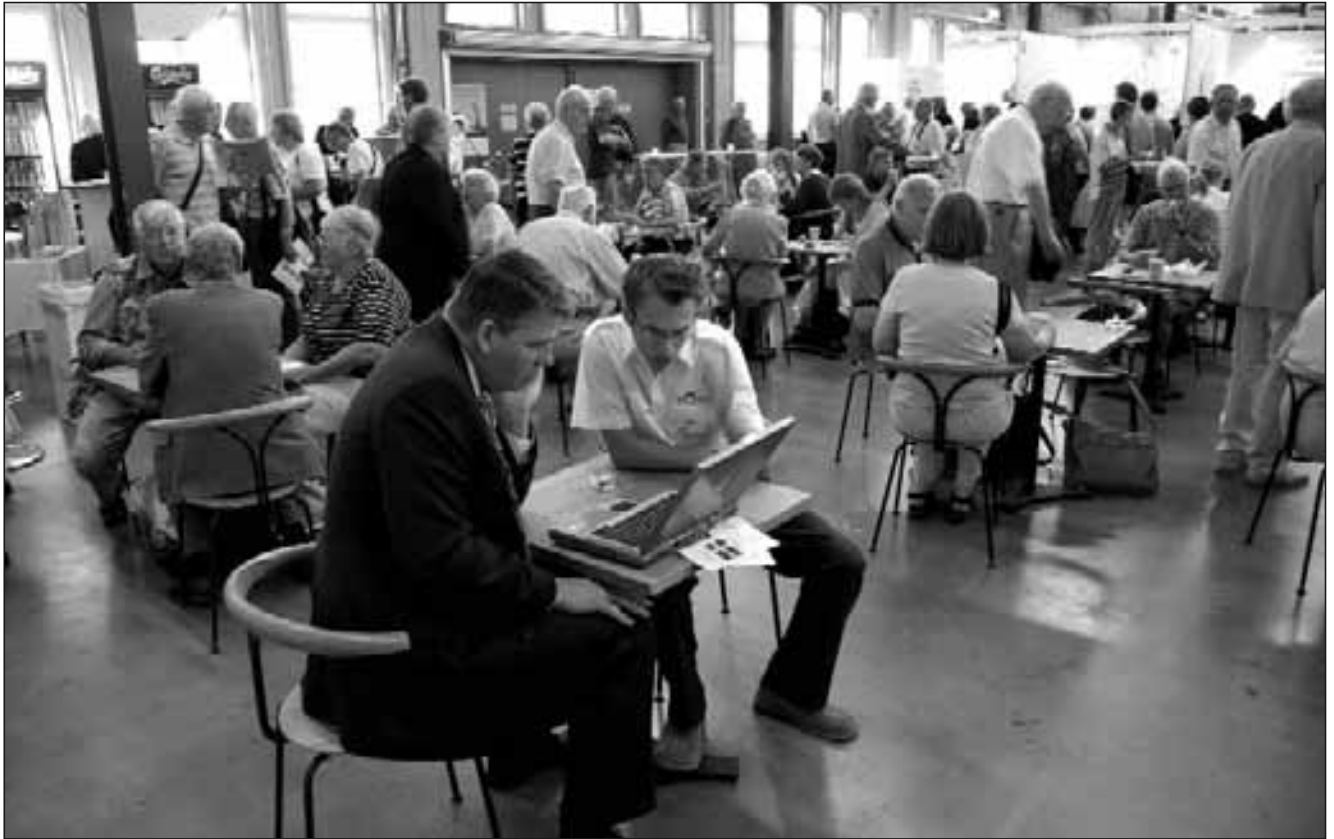
Släktforskar dagarna 2006 i Nacka - en välbesökt och lyckad tillställning - men den gick med underskott.

förverkliga i Sundbyberg. Av de tre stora föreningarna i huset har en valt att förlägga all sin utåtriktade verksamhet på annan plats, en annan brottas med så stora ekonomiska problem att den utåtriktade verksamheten nästan dött ut, medan den tredje visserligen har en stor och utmärkt verksamhet för sina medlemmar, men där intresset för gemensamma satsningar inom "Släktforskarcentrum" är nära nog obefintligt. Till detta kommer att den förnämliga hörsalen nu har så stora brister när det gäller den tekniska utrustningen att det av detta skäl har varit svårt att öka den externa uthyrningen.